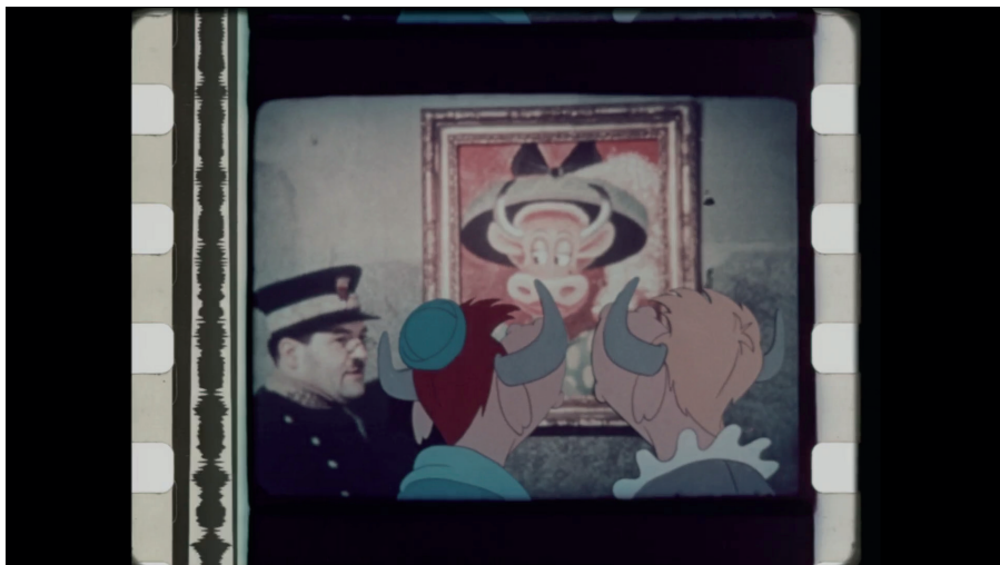
Fig. 5 Animazione con la tecnica del Dual Vision in Visita al castello , 1967