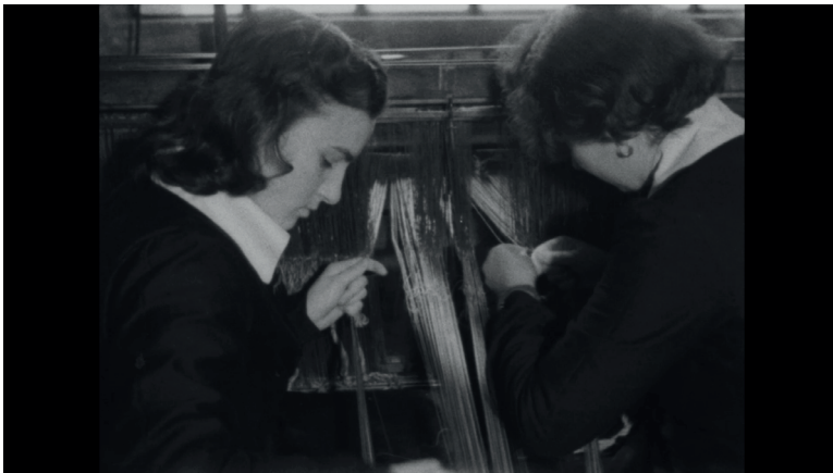
Fig. 4 Operaie al lavoro in uno stabilimento tessile del Biellese