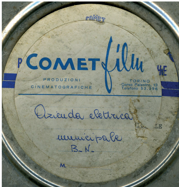
Fig. 1 Comet Film, scatola originale

particolarmente importante per l'Archivio Nazionale Cinema Impresa, perché il raggio d'azione della Comet Film si concentra proprio sul documentario industriale e sulla pubblicità, inserendosi in un contesto in cui, proprio a partire dagli anni Cinquanta, l'industria comincia a utilizzare abitualmente il cinema come strumento di formazione, comunicazione e pubblicità. In quegli anni le grandi aziende italiane istituiscono dipartimenti cinematografici aziendali da cui esce una produzione regolare di documentari industriali, film scientifici e di formazione destinati a diverse tipologie di pubblico e alle giurie dei festival internazionali di film industriale 7 . In questo contesto, ad esempio, nel 1952 a Torino nasce il Cinefiat 8 , casa di produzione cinematografica del Gruppo Fiat per la realizzazione di pubblicità e di film industriali. Questa produzione entra in vari circuiti distributivi del territorio e accresce di conseguenza l'interesse del pubblico verso temi come la crescita economica, il progresso tecnico-scientifico e il mondo del lavoro.