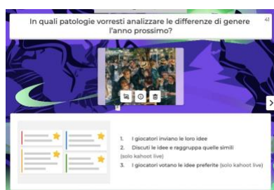
Figura 2. Brainstorming