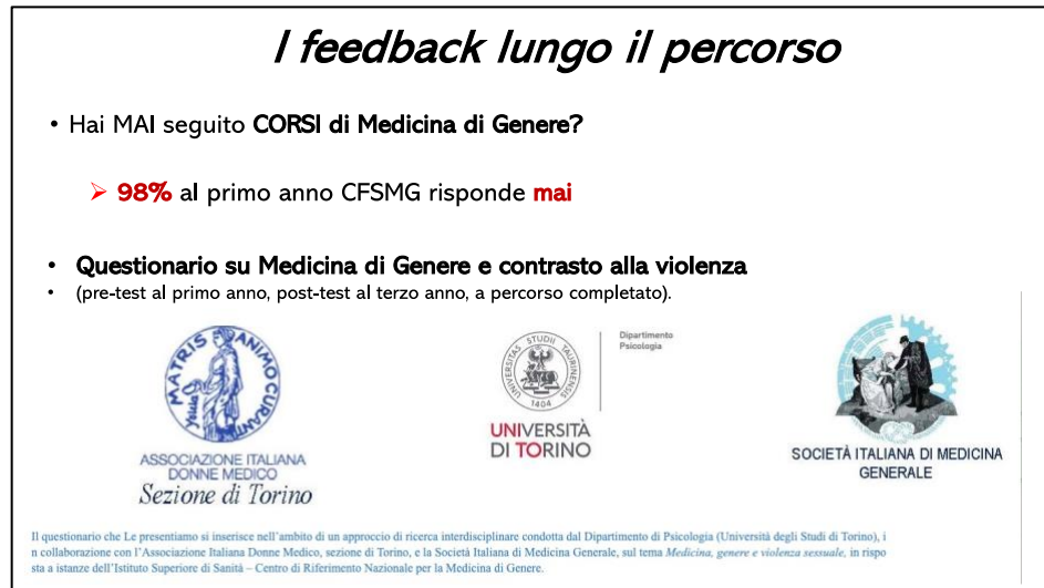
Figura 4. Questionario su Medicina di Genere e contrasto alla violenza

Infine, è stato proposto un questionario validato (figura 4) con l'intento di rilevare le percezioni relative alle differenze di genere in medicina e le rappresentazioni riferite alla violenza di genere.