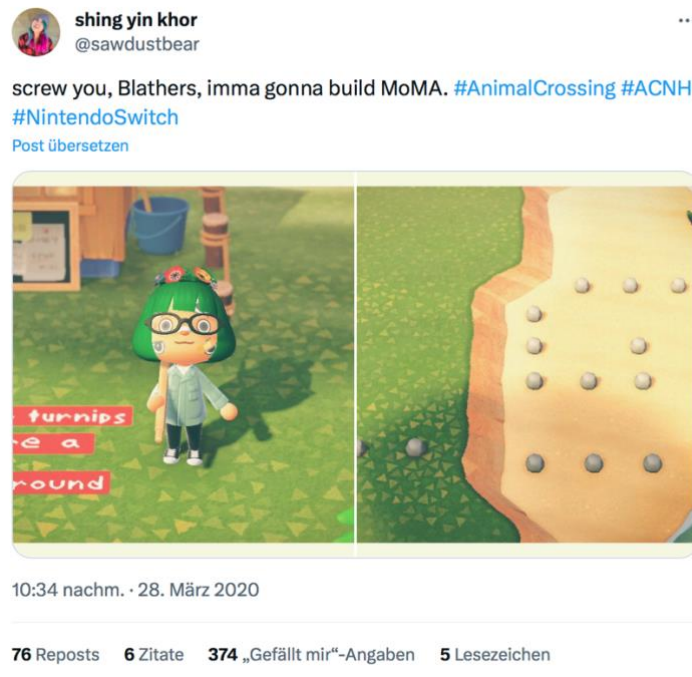
Abbildung 3 Screenshot: X (Twitter), Shing Yin Khor (@sawdustbear, “Screw you, Blathers, imma gonna build MoMA”, March 28, 2020. © Shing Yin Khor and Nintendo Courtesy of the artist.

( https://twitter.com/sawdustbear/status/1244015086043201539?ref_src=twsrc%5Etfw%7Ctwcamp%5Etweetembed%7Cwterm%5E1244015086043201539%7Ctwgr%5E93e5cfb7808f4d6ea7a80d2eda3cd9da69bbd1b%7Ctwcon%5Es1_c10&ref_url=https%3A%2F%2Fhypebeast.com%2F2020%2F4%2Fshing-yin-khor-marina-abramovic-artwork-recreated-animal-crossing-new-horizons )