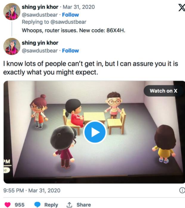
Abbildung 4 Screenshot: X (Twitter), Shing Yin Khor @sawdustbear, “Whoops, router issues” (2020), March 28, 2020. © Shing Yin Khor and Nintendo. Courtesy of the artist.

( https://twitter.com/sawdustbear/status/1245077349420261378?ref_src=twsrc%5Etfw%7Ctwcamp%5Etweetembed%7Cwtwrm%5E1245077349420261378%7Cwtwgr%5E33708f9eb369b24da28b1137dee579bc97901f6%7Ctwcon%5Es1_c10&ref_url=https%3A%2F%2Fwww.polygon.com%2F2020%2F4%2F1%2F21202880%2Fanimal-crossing-art-museum-installion-the-artist-is-present )