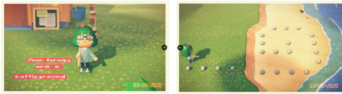
Abbildung 1 Screenshot: X (Twitter), Shing Yin Khor @sawdustbear, “Your Turnips are a Battleground” (2020), March 28, 2020.