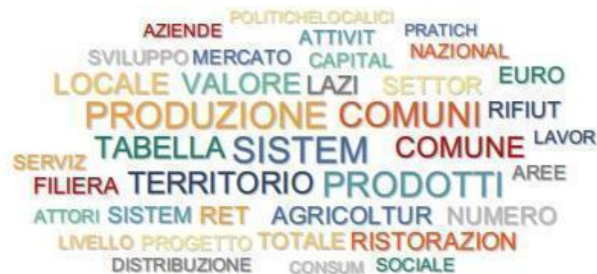
Figura 4 - Le parole delle "politiche locali del cibo"

Ricostruire un quadro organico dei discorsi, infine, emergenti in merito alle "politiche locali del cibo" è più arduo, essenzialmente perché, come segnalato precedentemente, il materiale esistente online è molto più ridotto. Al contempo, però, i testi si presentano nel complesso più omogenei e permettono quindi una più agevole identificazione dei nuclei tematici.