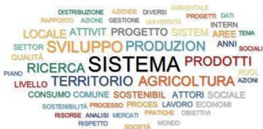
Figura 3 – Le parole delle “politiche urbane del cibo”

attendere il quadro diventa più preciso e, nel complesso, sembrano emergere cinque nuclei tematici principali.