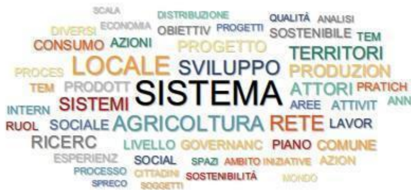
Figura 2 - Le parole delle "politiche del cibo"

Il tema più generale è quello dei sistemi delle politiche del cibo, intesi anzitutto su scala urbana e locale. Il riferimento è tanto agli obiettivi di tali politiche, quanto agli attori in gioco, nonché agli strumenti di governance, e dunque alla logica di pianificazione connessa a tali sistemi. Più nello specifico, quando si parla di sistema si parla sia di produzione che di consumo, sia di luoghi e territori che di processi. È dunque a questo sfondo generale che si ancorano poi alcuni discorsi più specifici e tecnici, come quelli sugli strumenti di policy, le modalità di monitoraggio e valutazione, gli indicatori, le strategie di coinvolgimento del territorio.