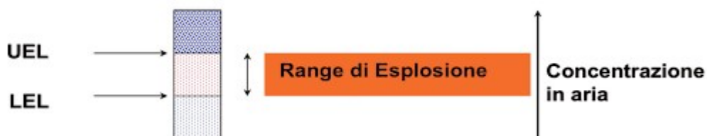
Figura 1.0 - Range di esplosione di una sostanza;

La percentuale di combustione minima e massima che, in determinate condizioni di prova, permette l'innescò dell'esplosione prende il nome rispettivamente di limite inferiore di esplodibilità (LEL: Lower Explosive Limit) e limite superiore di esplodibilità (UEL Upper Explosive Limit).