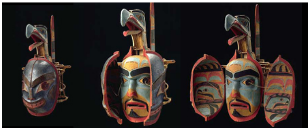
Maschera a livelli Kwakiutl

la trascendenza sia del nulla abitato di antenati da cui viene, che di quello in cui entrerà dopo la morte, è la maschera “a imposte” che sia i Kwakiutl, che altre popolazioni amerinde (come i Nootka e i Tlingit) utilizzavano per rendere visibile i livelli di impersonale di cui la persona è composta. Queste maschere stanno a simboleggiare lo sfondo impersonale che abita gli individui, inteso come quantum di morte che ogni individuo porta con sé al momento della nascita: al momento del venire al mondo il soggetto è sempre già antico, abitato dagli spiriti dei morti che lo hanno preceduto, che hanno già (pre-)stabilito la sua posizione nel cosmo.