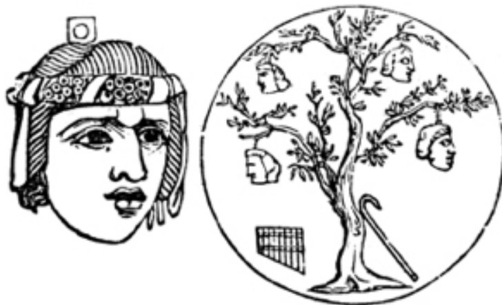
Incisione rappresentante un oscillum più vicino alla tradizione evocata da Meuli

Come detto, però, gli oscilla di cui parla Virgilio, in questo caso, non sono simboli apotropaici appesi agli alberi degli impiccati, ma addobbi per una particolare festa in onore dei Lari, le Compitalia . Queste feste erano particolarmente amate dagli schiavi, perché – come poi nella lunga tradizione che va dai Saturnalia al Carnevale – comportavano il dissolvimento e l’inversione dei ruoli sociali. Queste feste, legate topograficamente ai crocevia delle strade, luoghi dell’instabilità, dell’indecisione e del pericolo par excellence per i viaggiatori antichi, e al periodo dell’anno in cui l’inverno lascia il passo alla primavera, erano feste – ci dice Meuli – di “possessione”: «Posseduti, da intendersi in senso religioso, non medico, sono spesso in queste feste i portatori di maschere. [...] Lo spirito sceglie chi vuole, non distingue tra libero e non-libero, in questi giorni chiunque può essere posseduto da uno spirito, ciascuno ha diritto alla maschera e alla libertà del folle» (268).