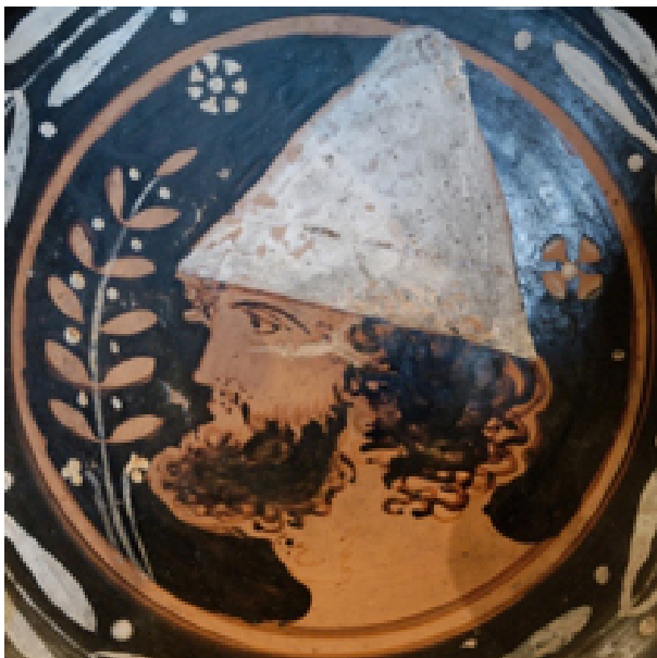
Pileus, di origine greca, in una raffigurazione su ceramica