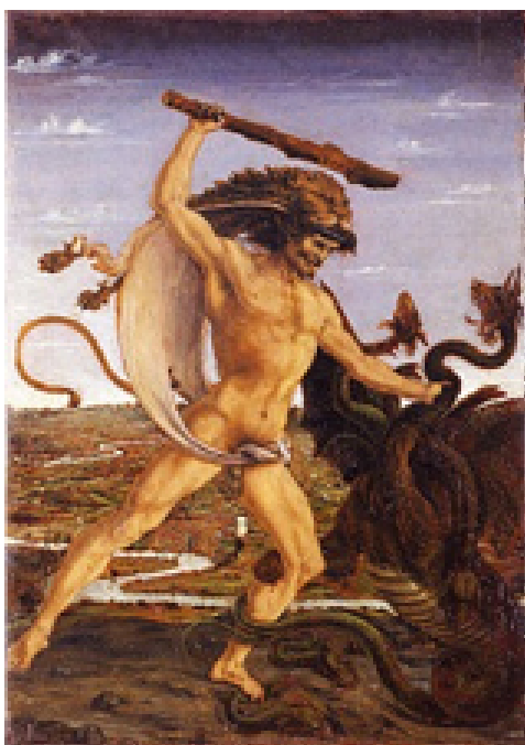
Antonio del Pollaiuolo, Ercole e l'idra, 1475 ca.

In particolare il galerius era un tipo di copricapo, tipico della tradizione italica ed etrusca (e non bisogna affatto sottovalutare che l'etimologia stessa della parola "persona" è incerta, ma di probabile origine etrusca) (Bund 2013, col. 657) ricavato da una pelle di animale, di cui restava la parte superiore della testa a mo' di copertura del capo della persona che la portava. Rappresentazioni prominenti, tramandateci da una lunga tradizione iconografica, di questo tipo di copricapo-maschera animale sono quelle di Ercole con la pelle di leone.