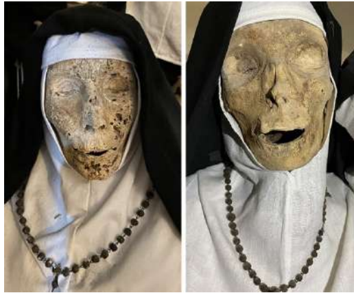
Fig. 7 - Ottimo grado di conservazione dei volti.