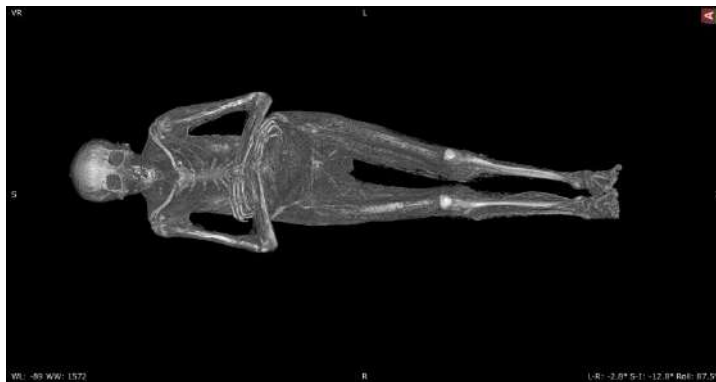
Fig. 9 - B