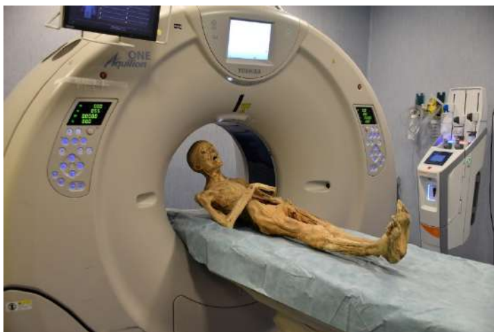
Fig. 9 - A

mento di frammenti da sottoporre a successive analisi di laboratorio 40 . La seconda fase del progetto prevede l'interpretazione dei dati morfologici e radiologici finora raccolti, in modo da orientare le successive analisi di laboratorio che costituiscono la parte conclusiva della ricerca. Le operazioni della prima fase sono state svolte in un locale apposito all'interno del monastero, mentre le indagini radiologiche sono state effettuate presso le strutture dell'Ospedale San Salvatore in L'Aquila al di fuori dell'orario lavorativo, in modo da non interferire con l'attività assistenziale e garantire il massimo riserbo alle operazioni. Il trasporto dei corpi è stato effettuato da apposita agenzia specializzata, spostando tre o quattro corpi per volta, con prelievo e riconsegna degli stessi nell'arco dello stesso giorno. Ogni mummia è stata sottoposta a tomografia computerizzata, onde consentirne la dettagliata visualizzazione ed ottenere ricostruzioni tridimensionali (fig. 9 - A, B, C).