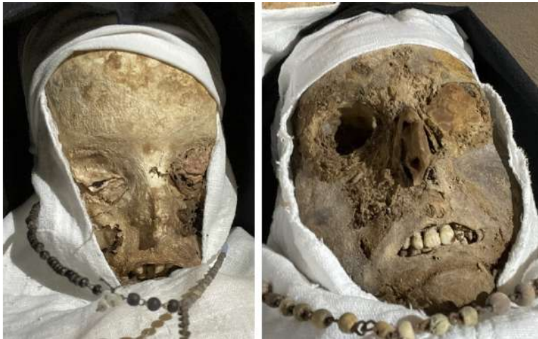
Fig. 8 - Pigmentazione rossastra palpebrale e riempimento orbitario.