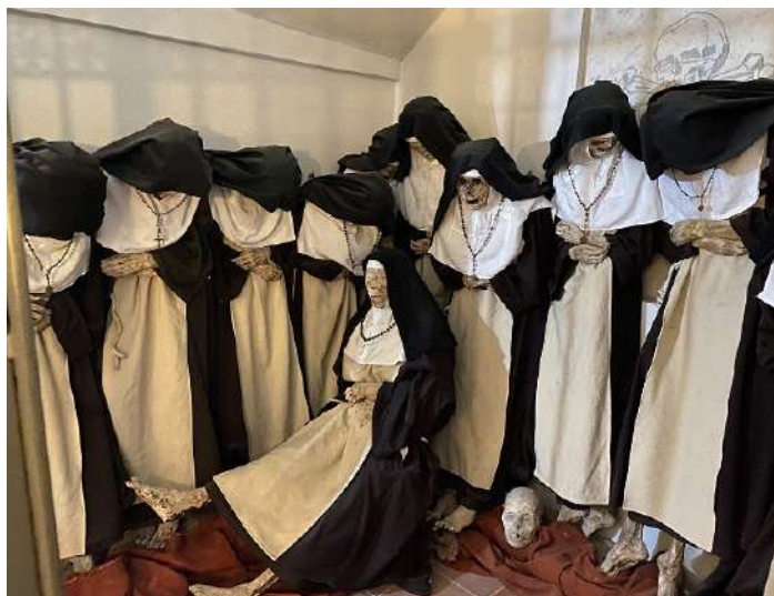
Fig. 6 - I corpi mummificati.

Da una stima approssimativa, l'età alla morte degli individui potrebbe risultare compresa tra i 30 e i 70 anni, per cui non può essere considerata molto rappresentativa. Non è stato possibile evidenziare condizioni patologiche degne di nota a carico delle superfici corporee non ricoperte dagli abiti.