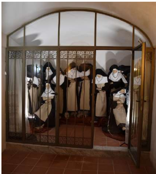
Fig. 5 - Attuale collocazione delle mummie all'interno del monastero.

In almeno otto mummie si osserva flessione a concavità anteriore del capo o del tronco, verosimilmente dovuta al protrarsi della posizione eretta del corpo mummificato, con parziale cedimento di alcune articolazioni. In un caso si osserva invece marcata flessione del capo di 90° sulla spalla sinistra.