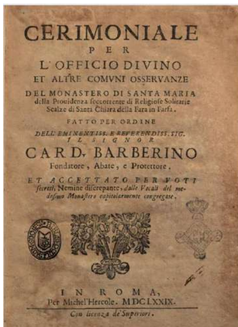
Fig. 3 - Frontespizio del "Cerimoniale" della comunità.

Informazioni utili sulle sepolture primarie delle monache sono state rinvenute nell' Inventario delle suppellettili e nel Cerimoniale del monastero (fig. 3) 11 . Questo inventario è conservato nell'Archivio del monastero e – nella sezione sacrestia-biancheria – elenca alcuni oggetti collegati al rito funebre ed al cimitero. Nell'elenco del 1696 ed in quello del 1877 sono menzionate delle tele nere e paonazze per il tumulo e delle tovaglie per il sepolcro 12 .