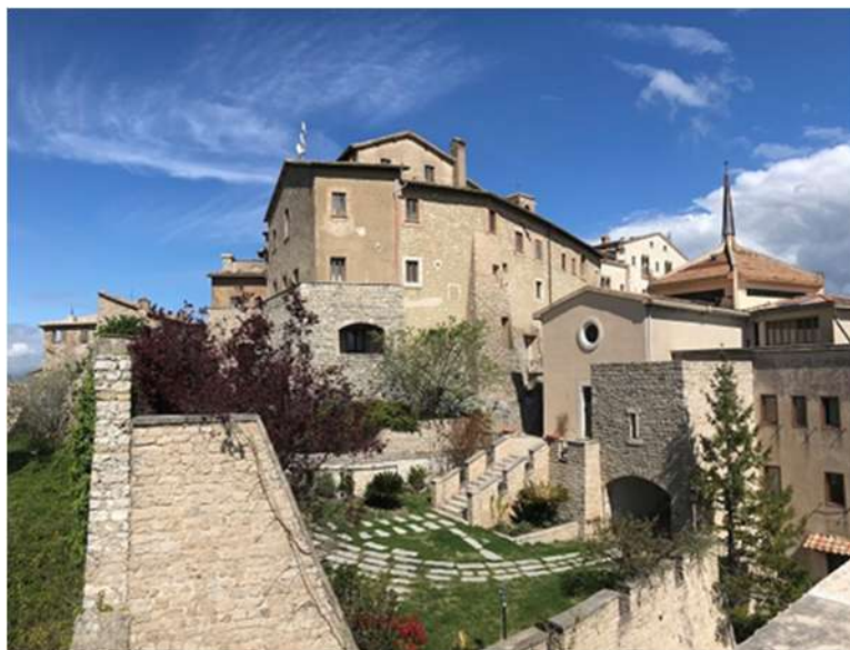
Fig. 1 - Il monastero delle Clarisse di Fara in Sabina

All'inizio del 2022 abbiamo effettuato un sopralluogo tecnico preliminare dei corpi mummificati, finalizzato alla redazione di un progetto di studio sottoposto all'approvazione della attuale comunità monastica. In tale occasione è stato possibile effettuare il rilievo delle condizioni di temperatura e umidità relativa dell'ambiente in cui le mummie sono attualmente custodite, nonché generica documentazione fotografica delle stesse.