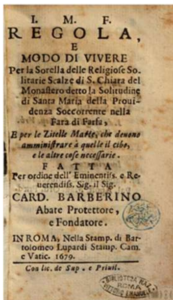
Fig. 4 - Frontespizio della Regola del monastero.

In media navi adest sepulchrum, ad quod patet aditus ex interiori clausura, ibidemque monialium cadavera sepeliuntur.