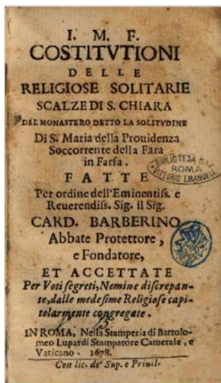
Fig. 2 - Frontespizio delle "Costituzioni" farnesiane.

Sin dall'inizio la comunità delle Clarisse Eremita accolse numerose fanciulle provenienti da Roma e da famiglie altolocate 8 . Dal 1680, completata la costruzione e l'organizzazione del monastero, si affermarono due stili di vita monastica distinti: da un lato le Marte , che provvedevano alle necessità del monastero e delle sorelle solitarie; dall'altro le Marie , in strettissima clausura, che si dedicavano a pratiche contemplative e meditative 9 .