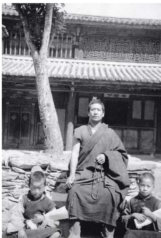
Fotografia nro 2.a: Lama di Atenze con giovani monaci