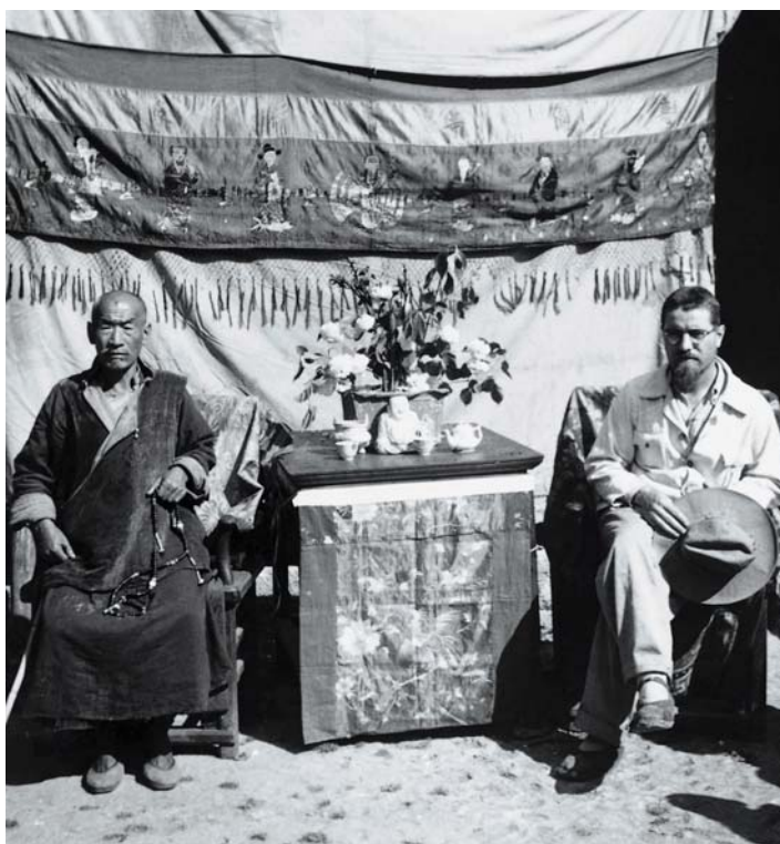
Fotografia nro 15: Padre Lovey ospite presso un lama

Il 27 luglio del 1944, dopo due anni di assoluto silenzio, la Congregazione del Gran San Bernardo ricevette un messaggio conciso dalla terra di missione: «Non siate in pena per noi, qui va tutto bene, padre Lattion» 19 . Con il finire della seconda guerra mondiale, l'arrivo della Quarta e ultima spedizione (1946), non solo la missione rientrò in uno stato di attività ma, in Svizzera, si assistette ad un rinnovato interesse per le vicissitudini dei canonici partiti in Cina. Questa fase ebbe però breve durata. La Cina, devastata dalla guerra civile che sarebbe terminata da lì a poco con l'ascesa di Mao al governo, era un palcoscenico instabile e i missionari tornano presto ad essere presenze sgradite. Si interroga padre Tornay: «Cosa sono diventato? È semplice descrivermi. Sono uno straniero, in una terra straniera [...] sono un pastore senza gregge, in mezzo ad un popolo senza pastori» 20 . Lo stesso Tornay verrà trucidato, l'11 agosto 1949, all'età di 39 anni, nel tentativo di recarsi a Lhasa per portare davanti al Dalai-Lama la causa della sua missione, perennemente minacciata dai monasteri locali.