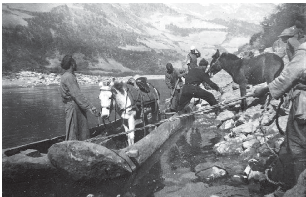
Fotografia nro 16: Canoa per l'attraversamento dei fiumi