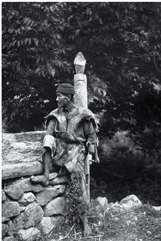
Fotografi nro 13: Lo stregone di Cezhong