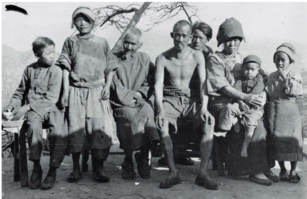
Fotografia nro 8: Famiglia di contadini cattolici di Weixi

Di ritorno da questo primo viaggio di esplorazione, i due giovani canonici riuscirono grazie al loro entusiasmo a portare la causa della missione tibetana davanti alla consiglio capitolare dell'ordine e, nel luglio del 1932, venne approvato all'unanimità il progetto di creare una missione cosiddetta tibetana 9 .