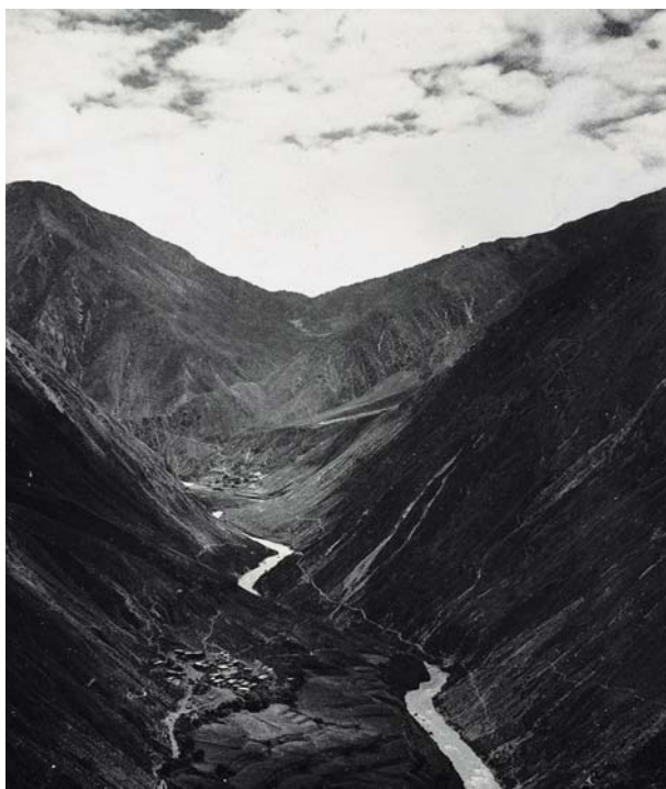
Fotografia nro 1: Frontiera sino-tibetana

Nel XVI e XVII secolo si assiste ad un intreccio degli interessi e degli intenti spirituali della Chiesa con quelli economico-politici dei Regni europei, cosicché missionari e conquistadores si lanciano alla scoperta e alla conquista di terre fino allora celate e protette dal velo della leggenda. Prima fra tutte il Tibet. L'interesse dei missionari per questa regione, di cui si sapeva poco o nulla, era in buona misura dettato da un errore storico-geografico che andò maturando nel corso del sedicesimo secolo, errore che portò l'identificazione dei cristiani dell'antico Catai con gli abitanti del Tibet e la conseguente identificazione dei due paesi. Il nome Catai deriva quasi sicuramente dalla dinastia Khitan, ricordata negli annuali col nome di Liao 1 , che regnò sulle province settentrionali della Cina tra il 907 e il 1125 d.C. Questo Catai giunse in Europa con Giovanni del Piano dei Carpini (che lasciò l'Oriente nel 1246), Guglielmo di Rubruck (rientrato nel 1246) e, infine, grazie alla memorabile opera di Marco Polo.