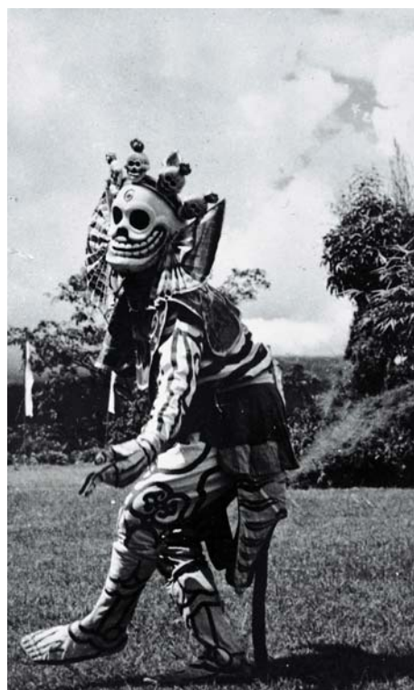
Fotografia nro 3.a: Mahakala, il Grande Nero, un Guardiano della Legge (Chos Skyong), con la sua collana di ossa umane e sulla maschera il terzo occhio sormontato dai cinque teschi, tutti simboli del conseguimento della saggezza