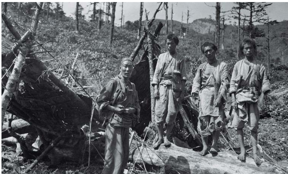
Fotografia nro 11.a: 1935, operai Lissou dell'impresa cinese

descrizione del colle: «Ancor prima di aver intrapreso la costruzione delle basi dell'Ospizio, tutto ci faceva presupporre che La-tsa sarebbe stata la strada del futuro. Tuttavia, a noi bastava sapere che questo passo era molto frequentato, lungo e pericoloso per i numerosi viaggiatori che l'affrontavano». Le difficoltà di realizzare quest'opera iniziarono ancor prima della costruzione stessa. Diffidenti nei confronti dei "lama dagli occhi bianchi", come venivano chiamati in queste regioni i missionari, i burocrati locali non credevano che lo scopo ultimo fosse davvero la costruzione di ospizio su di un colle tanto impervio. Ben presto si diffuse la voce che sul colle di Latsa i missionari avessero trovato una vena aurifera e questo ritardò di ben 18 mesi il rilascio dei permessi richiesti, e solamente il 17 giugno del 1935 ottennero il permesso di costruire sul colle. Assoldati diversi operai per la realizzazione dell'opera, i missionari raggiunsero il colle sotto una pioggia battente. Il diario di Latsa (1935-1938), tenuto da padre Melly, nei mesi estivi di lavoro sul colle, inizia tutti i giorni con: «Il tempo non cambia, pioggia, vento e neve» 12 .