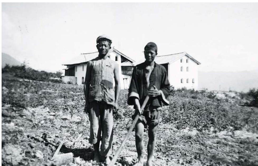
Fotografia nro 14.b: Al probandato di Hualopa ad ogni alunno veniva affidato un piccolo appezzamento di

famiglie qui composent mon voisinage, 4 à 5 ont suffisamment à manger. Les autres mangent, devine quoi: des racines de fougères. Aujourd'hui, on voulait me vendre des enfants. Par-ci, par-là, des gens meurent».