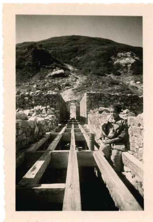
Fotografia nro 12.a: Estate 1936, l'imprenditore cinese mentre visiona la costruzione dell'Ospizio