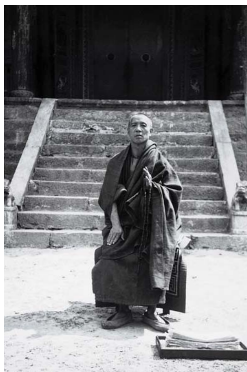
Fotografia nro 2.b: Lama di Xiao-Weixi

Sebbene alcuni padri fossero già penetrati nella regione nel corso dei viaggi in Cina, fu il padre gesuita portoghese Antonio D'Andrate (1580-1634) che raggiunse il Tibet occidentale per primo, valicando il passo himalayano del Mana 4 . Nel 1625, l'Europa venne scossa da una notizia sensazionale: la scoperta del Gran Cataio, scoperta testimoniata da un libretto intitolato Novo Descobrimiento do Gram Cataro, ou Reinos de Tibet, pello Padre Antonio de Andrade da Companhia de Iesu, Portugez no anno 1624 , che tradotto in spagnolo, italiano, francese e tedesco, fece ben presto il giro del Vecchio Continente. L'intento di rintracciare