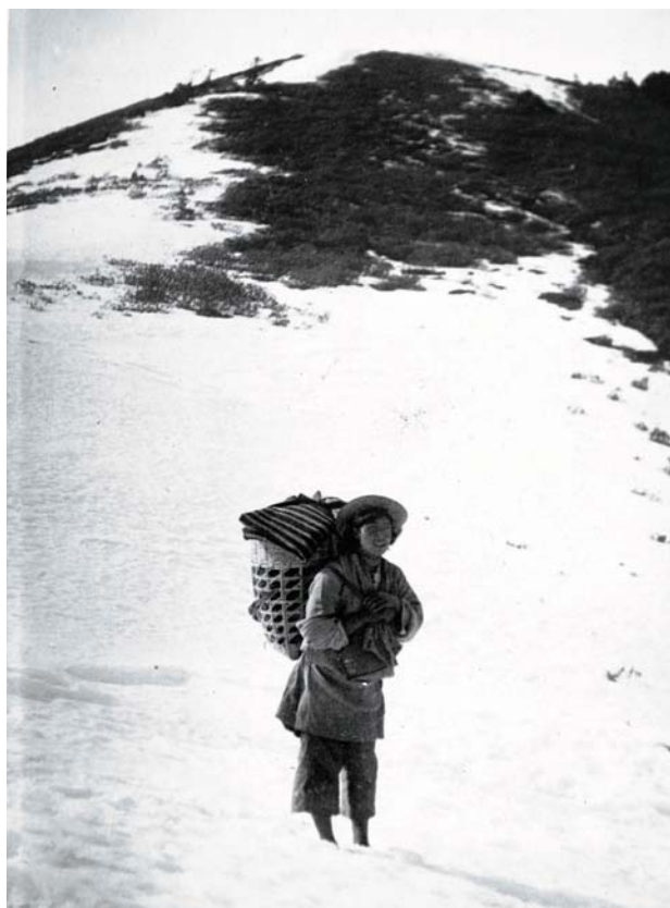
Fotografia nro 10: Un portatore sul sentiero per Latsa

Posti d'innanzi ad una realtà tanto differente, la prima reazione fu l'incertezza: «L'avvenire ci pareva colmo di enigmi. Avremmo potuto, secondo i nostri progetti, compiere questa opera missionaria? Non saremmo presto caduti in preda di malattie o briganti? Avremmo stabilito dei contatti con questa popolazione indigena che, di primo acchito, ci parve diffidente e ostile [...] il nostro scopo sarebbe stato compreso?» 10 . Incertezza dunque ma incertezza mista a curiosità, voglia di scoprire e addentrarsi in questo paese che non poteva non ammaliare. Prima tra tutte le attività, lo studio del cinese. In secondo luogo il tentativo di entrare in contatto con la popolazione locale. Fissata Weixi, nel corno nord-occidentale dello Yunnan, i canonici aprirono un dispensario medico e una scuola, da sempre opere che permettevano di incidere il muro di diffidenza che separava i missionari dalle comunità locali. Non da ultimo, la ricerca di un colle sul quale intraprendere la costruzione di un nuovo ospizio del San Bernardo. Primi ad aver introdotto in queste regioni gli sci, i giovani missionari effettuarono numerose spedizioni nelle montagne circostanti, alla ricerca di un colle adatto allo scopo prefissato.