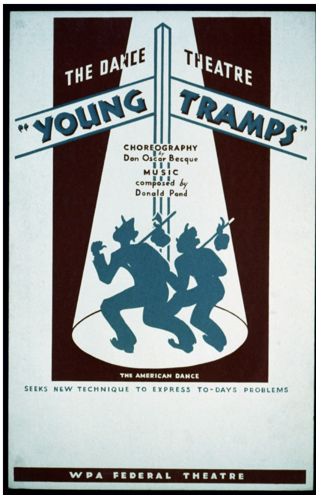
Library of Congress, Poster for Federal Dance Theatre Project presentation of "Young Tramps" ( New York : Federal Art Project, 1936 or 1937 ), https://lccn.loc.gov/98514968 .