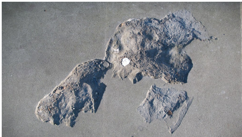
Boyan Drevec, Géographie (2011), CC BY-NC-ND, https://flic.kr/p/9fEvTv .

La littérature encyclopédique et lexicologique est précieuse pour cerner la géographie à son époque, par sa volonté de délivrer des connaissances précises et concises, elle permet de mieux la saisir que des ouvrages de géographie plus spécialisés dans lesquels les auteurs manquent de recul. Il ne faut pas pourtant en attendre une vision qui révolutionnerait la discipline même si cette littérature est en prise avec ses progrès. Elle révèle pleinement que la géographie est un savoir d'État tant dans son organisation que dans sa finalité. Peut-on y déceler une orientation militante qui réclamerait encore plus d'implication de l'État ou qui en revanche plaiderait pour l'émancipation face à une tutelle étatique ? Les auteurs conscients de l'essor de la géographie loin de percevoir le rôle de l'État comme négatif sont acquis à l'idée qu'il participe à cet essor. Une évolution est perceptible entre l' Encyclopédie de Diderot et de d'Alembert et l' Encyclopédie méthodique : la géographie, pour se renforcer, doit davantage démontrer son utilité, utilité qui passe surtout par l'État.