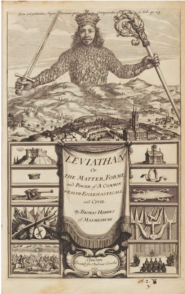
The frontcover of Hobbes' Leviathan, edition of 1651.