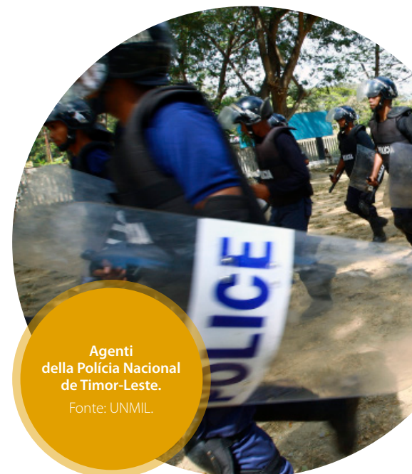
Agenti della Polícia Nacional de Timor-Leste.

rezza e il consolidamento di obiettivi a breve termine. Nel tempo, si è quindi sempre più rafforzato l'inestricabile nesso tra sicurezza e sviluppo e non vi è dubbio che anche l'approccio alla SSR sia basato sul concetto che la cre-