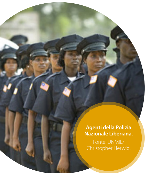
Agenti della Polizia Nazionale Liberiana.