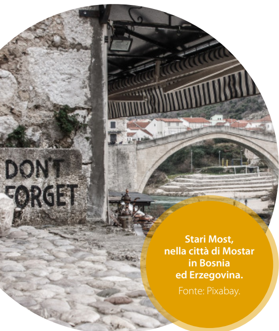
Stari Most, nella città di Mostar in Bosnia ed Erzegovina.