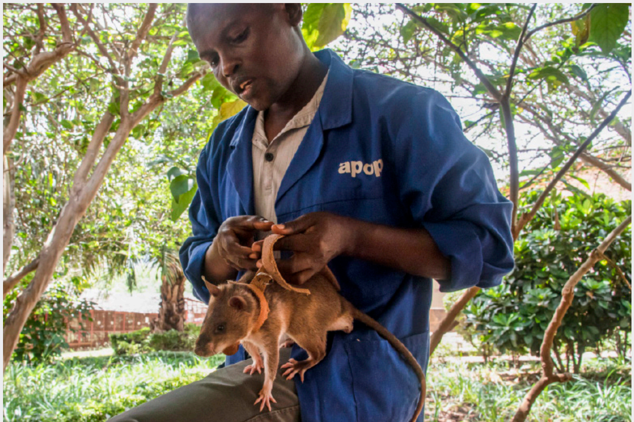
Abdullah e uno degli HeroRAT durante la fase di socializzazione.