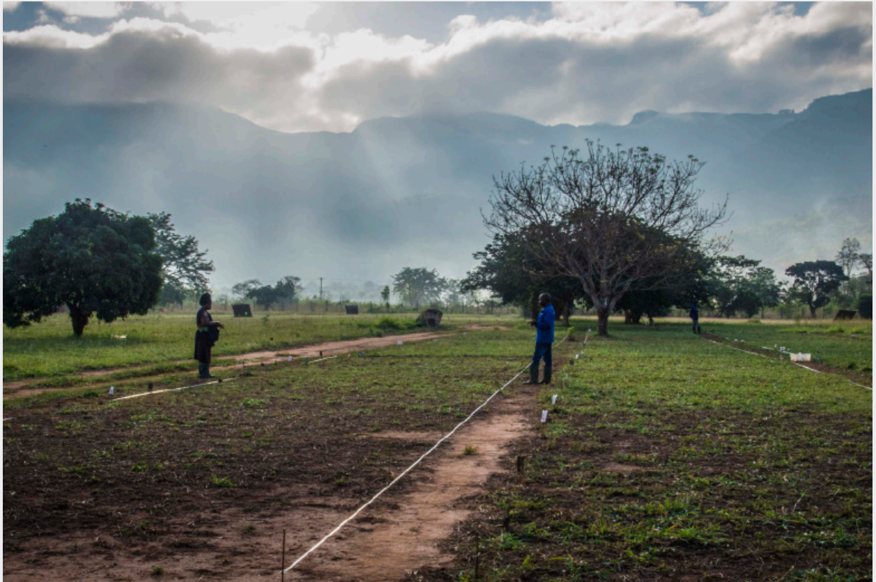
Due operatori di APOPO durante l'addestramento alla ricerca sul campo a Morogoro.