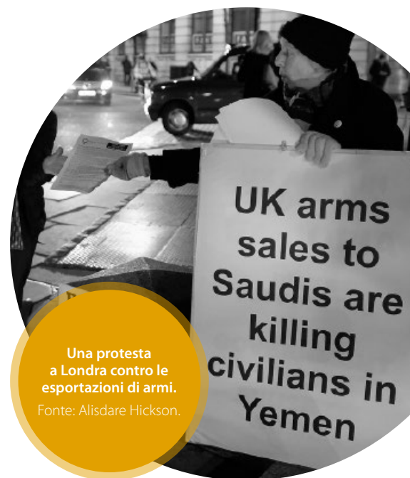
Una protesta a Londra contro le esportazioni di armi.

Il 20 giugno 2019 una nuova sentenza ha parzialmente ribaltato la decisione dell'Alta corte. La Corte d'appello è infatti giunta alla conclusione che il processo decisionale del governo "ha commesso un errore di diritto" nel valutare correttamente la presenza di un chiaro rischio di gravi violazioni del diritto internazionale umanitario. Nello specifico, la Corte d'appello ha obiettato che la questione dell'esistenza di precedenti violazioni del diritto internazionale umanitario da parte della coalizione rappresentava un aspetto cruciale per stimarne il rischio futuro. Il fatto che il governo facesse affidamento sullo stretto legame con l'Arabia Saudita senza fare un'analisi delle violazioni passate, non era quindi sufficiente per permettere di concludere razionalmente che non ci fosse un chiaro rischio di gravi violazioni del diritto internazionale umanitario. La Corte d'appello ha inoltre sottolineato che il governo