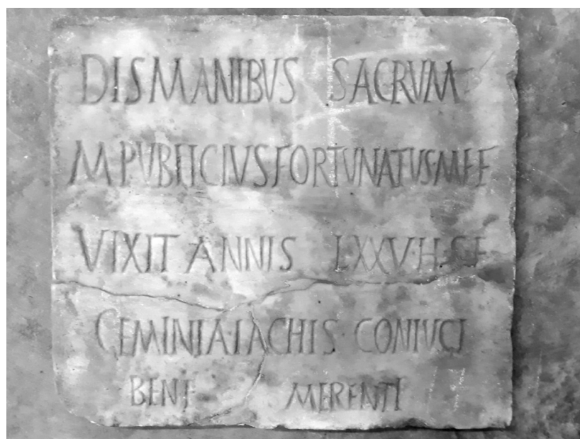
Fig. 5. Taranto, ex convento di S. Antonio nr. inv. 37127.