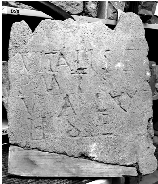
Fig. 1. Taranto, ex convento di S. Antonio nr. inv. 37241