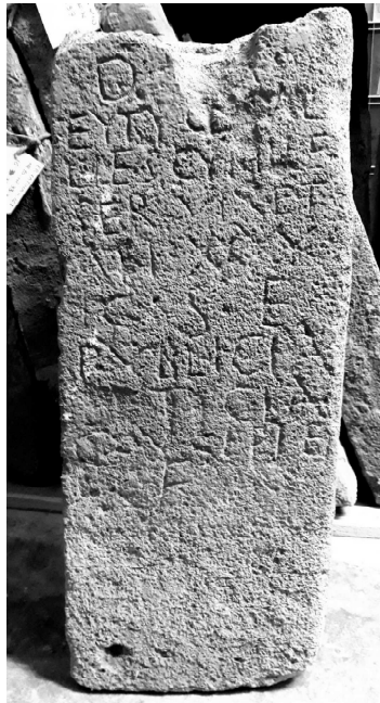
Fig. 7. Taranto, ex convento di S. Antonio nr. inv. 37160.