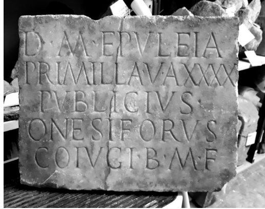
Fig. 6. Taranto, ex convento di S. Antonio nr. inv. 37103.