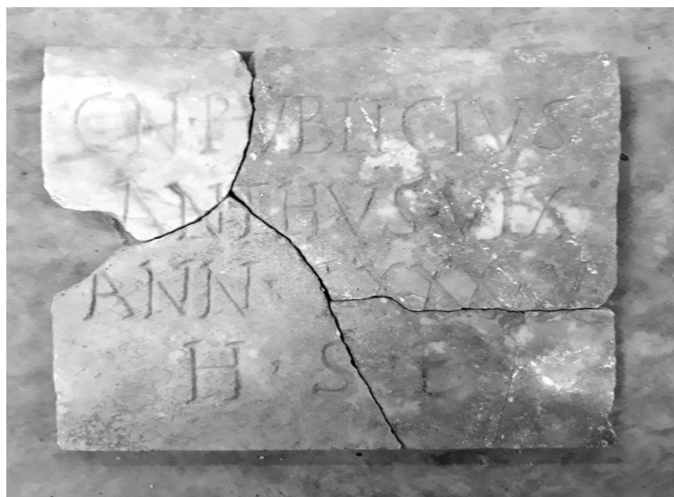
Fig.. 2. Taranto, ex convento di S. Antonio nr. inv. 37105