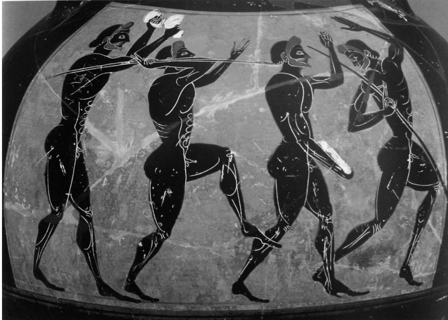
Εικ. 1 Παράσταση πενταθλητών σε Παναθηναϊκό αμφορέα. Από αριστερά: άλτης, ακοντιστής, δισκοβόλος και ένας ακόμα ακοντιστής. Β΄ μισό 6 ου αιώνα π.Χ. Λονδίνο, Βρετανικό Μουσείο.