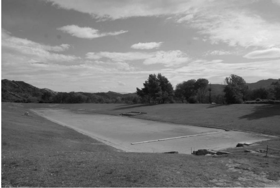
Εικ. 13 Το Στάδιο της Ολυμπίας. Διακρίνονται στο νότιο πρανάς η εξέδρα των Ελλανοδικών και απέναντι ο βωμός της θεάς Δήμητρας Χαμώνης, 5 ος αιώνας π.Χ.