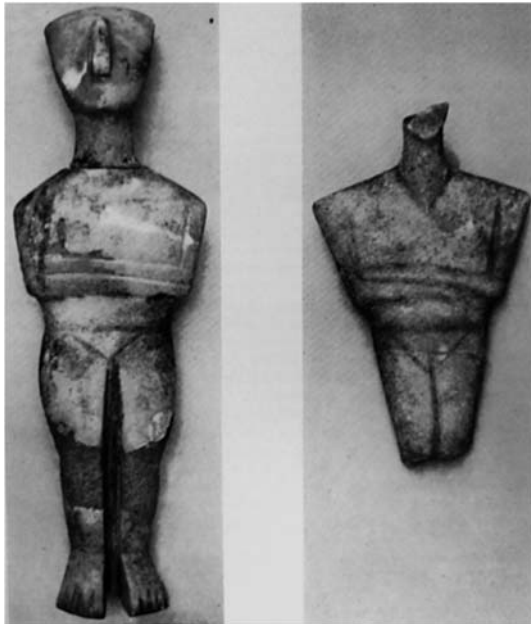
Εικ. 10 Λίθινα ειδώλια πρωτοκυκλαδικής τεχνοτροπίας από την περιοχή του Αγίου Ανδρέα (Φειά). Αρχαιολογικό Μουσείο Πύργου.