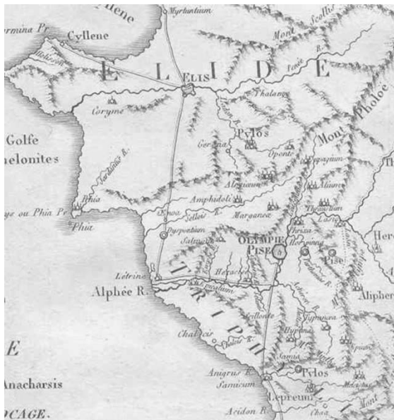
Εικ. 12 Χάρτης της Ηλείας επιμελημένος από τον Μ. Barbé Du Bocage, κατά τα παραδιδόμενα του περιηγητή Πασανία. Διακρίνονται η Κολλήνη και η Φειά, καθώς και η οδική τους σύνδεση με την Ήλιδα και την Ολυμπία. Τίτλος χάρτη: L'Élide et la Tryphilie. Pour le Voyage du Jeune Anacharsis , 1786.