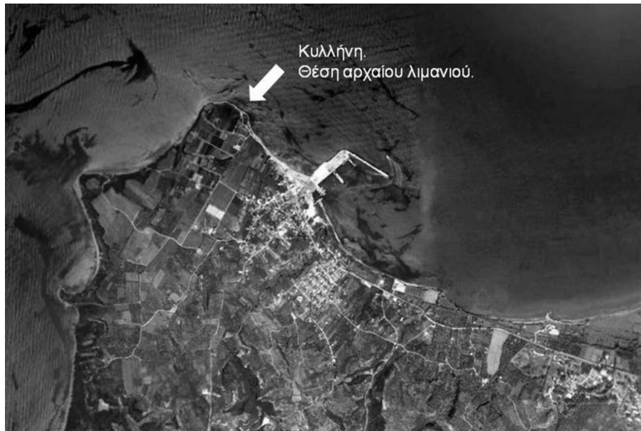
Εικ. 5 Ακρωτήριο Κυλλήνης. Εικόνα από δορυφόρο ( Google Earth ).