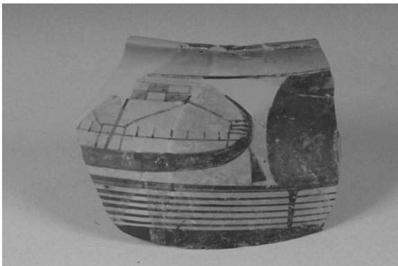
Εικ. 2 Τμήμα κρατήρα με παράσταση πλοίου. Ύστεροι Γεωμετρικοί Χρόνοι. Αρχαιολογικό Μουσείο Ήλιδας.