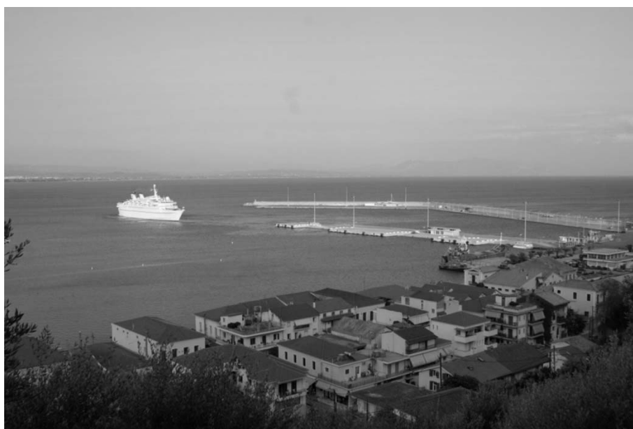
Εικ. 16 Άποψη του σύγχρονου λιμανιού του Κατακόλου.