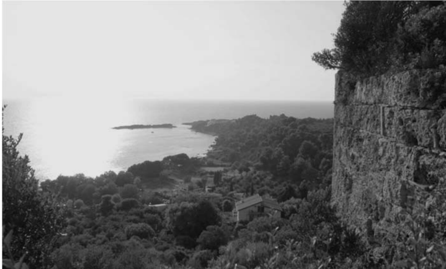
Εικ. 9 Άποψη του λιμένα της Φειάς (σημερινή παραλία Αγίου Ανδρέα Κατακόλου) από την κορυφή του λόφου Ποντικόκαστρο. Διακρίνονται λείψανα του μεσαιωνικού πύργου, ιδρυμένου πάνω στα τείχη της αρχαίας ακρόπολης της Φειάς.