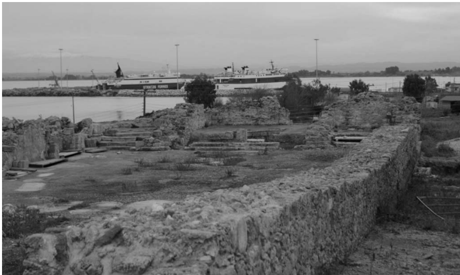
Εικ. 6 Τα λείψανα του φράγκικου καθεδρικού ναού της Γλαρέντζας, 13 ος αιώνας μ.Χ. Στο βάθος το σύγχρονο λιμάνι της Κυλλήνης.