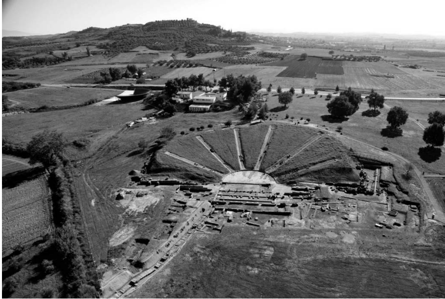
Εικ. 11 Το Θέατρο της Ήλιδας. Διακρίνεται επίσης το ξύλινο θέατρο δίπλα στις εγκαταστάσεις της Παλαιάς Αρχαιολογικής Συλλογής της Ήλιδας. Στο φόντο ο λόφος της αρχαίας ακρόπολης. Αεροφωτογραφία.