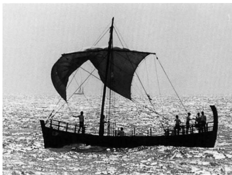
Εικ. 15 Ομοίωμα πλοίου (Κυρήνεια ΙΙ) του 4 ου αιώνα π.Χ. (Ελληνικό Ινστιτούτο Προστασίας της Ναυτικής Παράδοσης, Αθήνα).