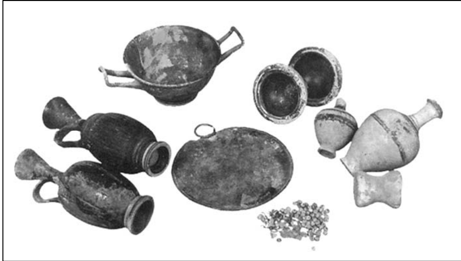
Εικ. 7 Περιεχόμενο ταφικού πίθου με ζεύγος νεκρών από την περιοχή της Κυλλήνης. Τα κτερίσματα (ηλειακές μελαμβαφείς λύκηθοι, αρυβαλλοειδή λυκήθια, φιαλίδια κλπ.) απαντώνται συχνά σε όλη την Ηλεία τον 4 ο αιώνα π.Χ. (Αρχαιολογία: Πελοπόννησος, εκδ. Μέλισσα, Αθήνα 2012).