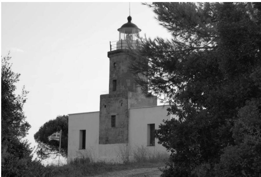
Εικ. 17 Ο φάρος του Κατακόλου, κτίριο «...σημαντικό για την ιστορία της ναυσιπλοΐας στο Ιόνιο...συνδεδεμένο με τις μνήμες των ναυτικών και γενικότερα των κατοίκων της περιοχής», σύμφωνα με την κήρυξή του από το Υπουργείο Πολιτισμού (ΦΕΚ 1353/Β/17-10-2001).