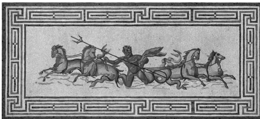
Εικ. 4 Ψηφιδωτή εικονιστική θαλάσσια παράσταση από το δάπεδο του περιστυλίου των Θερμών του Κρονίου στο ιερό της Ολυμπίας. Ο Τρίτων, θαλάσσιος δαίμων, γιος του Ποσειδώνα και της Αμφιτρίτης, αποτελεί την κεντρική μορφή της παράστασης. Ως άλλος ηνίοχος, απεικονίζεται κρατώντας τρίαίνα να οδηγήει δύο ζεύγη θαλάσσιων ίππων, που σέρνουν τον ίδιο επάνω στα κύματα της θάλασσας, χωρίς άρμα. Ρωμαϊκοί Χρόνοι.