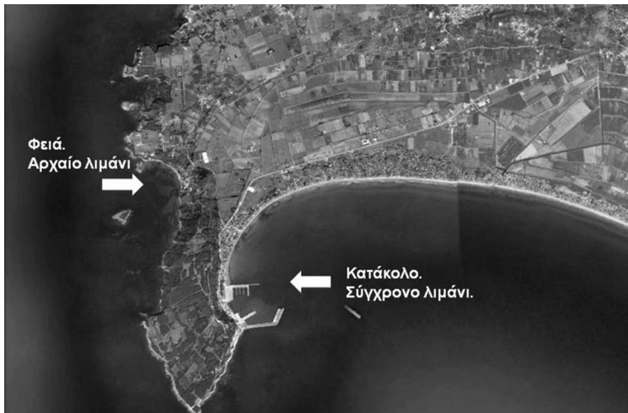
Εικ. 8 Ακροτήριο Ιχθύς (Κατάκολο). Εικόνα από δορυφόρο.