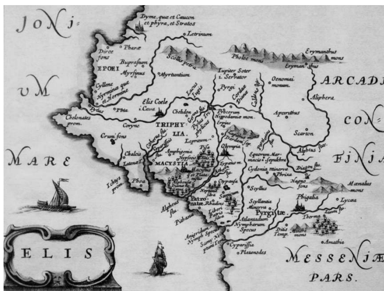
Εικ. 3 Χάρτης της Ηλείας βασισμένος στο κείμενο του γεωγράφου Στράβωνα. Μεταξύ των αρχαίων τοπωνυμίων η Κυλλήνη και η Φειά. Με μικρές αποκλίσεις, σημειώνονται τα σωστή γεωγραφική τους θέση. Johannes Wilhelm Laurenberg, 1661.