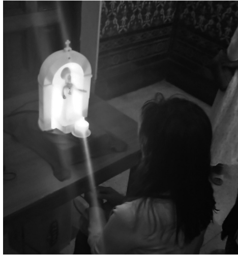
Il robot SanTO durante un esperimento in una chiesa a Miraflores, Lima, Perù.

della divinità. Questo dato è un'ulteriore prova di quanto sia importante il design estetico del robot, e al tempo stesso indica che la percezione è soggettiva, che è un limite al campo di utilizzo del robot in futuro. Questa ricerca si sta muovendo in un territorio inesplorato, con unico punto di riferimento le corrispondenze con il passato. Tuttavia, grazie all'interesse globale che questo progetto sta suscitando, tra cui opere e studi diversi in competizione, presto sarà possibile avere un quadro più completo e assicurare che l'uso di queste nuove tecnologie sia morale e che risulti socialmente utile.