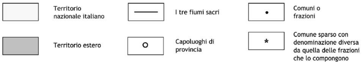
Figura 1: Carta geografica dei luoghi citati