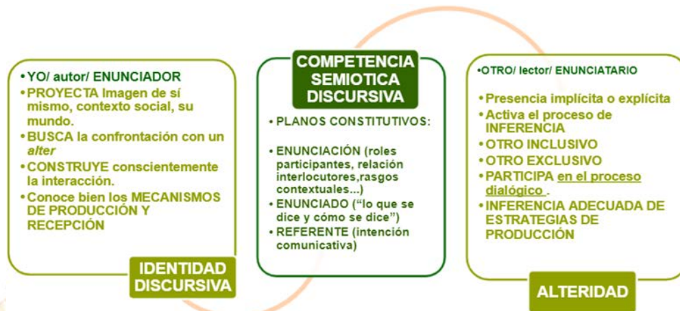
Figura 1. Competencia Semiótica Discursiva. Elaboración propia con base en Serrano (2000)

Como se deduce de la Figura 1, en el plano de la interacción discursiva las distintas voces enunciativas ponen de manifiesto el conocimiento de estrategias de producción textual en relación con la intención comunicativa dentro del contexto de situación y cultural en el que se activan los procesos de inferencia textual. Las marcas discursivas y lingüísticas que construyen los procesos de actuación e inferencia discursiva revelan el dominio de competencia semiótica discursiva de las voces enunciativas y voces de alteridad en los procesos intencionales e inferenciales elaborados (Leal Rivas, 2019: 37-38).