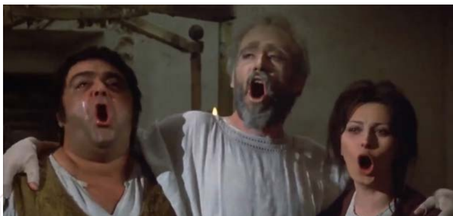
FIGURA 2: JAMES COCO, PETER O'TOOLE E SOFIA LOREN NEL FILM DEL 1972