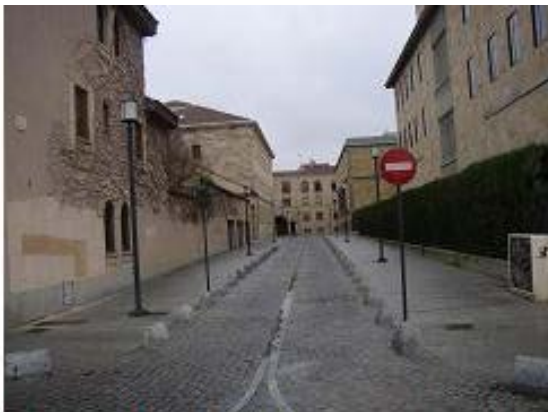
Calle del Desafiadero (hoy de la Plata)

Es una calle que aparece con frecuencia en los textos medievales y que parece que debe su nombre a ser