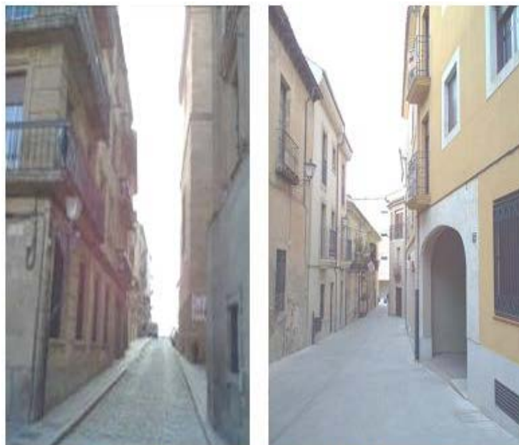
Calle de Escoto. Calle de Placentinos

Religiosos: *CISNEROS, ESCOTO [39] , JUAN DEL REY (1250, canónigo de la Catedral).