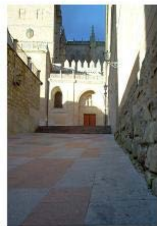
Calle de Tentenecio

Santa Teresa. En las Fundaciones [71] , en el capítulo 18, Santa Teresa cuenta "la fundación del monesterio de San Josef, de Salamanca, que fue año de 1570. Trata de algunos avisos para las prioras, importantes". Estando en Toledo, "me