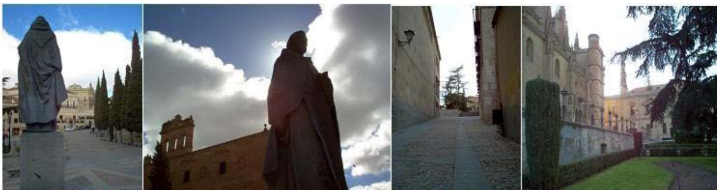
Plaza de Trento (frente a fachada de San Esteban)

FRANCISCO DE VITORIA. DEL CONVENTO AL ESTUDIO. En sus últimos años de vida, los escolares trasladaban al Padre Vitoria, enfermo de gota y casi paralítico, a la clase de su cátedra de Teología, desde el convento de San Esteban al Estudio (en 1545 ya no pudo ir a Trento y muere al año siguiente).