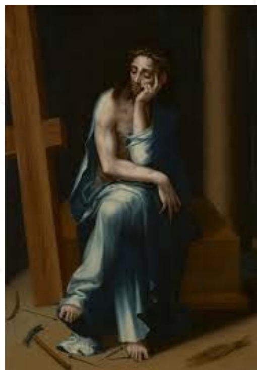
Fig. 4. Luis de Morales, Cristo, varón de dolores , 1560 ca., The Minneapolis Institute of Art, óleo sobre tabla 64,5 x 46,4 cm