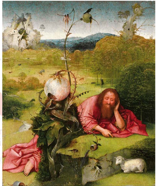
Fig. 6, Hieronymus Bosch, San Juan Bautista en el desierto , ca. 1489, Museo Lázaro Galdiano, Madrid, óleo sobre tabla, 48,5 x 40 cm https://commons.wikimedia.org/w/index.php?curid=23590649