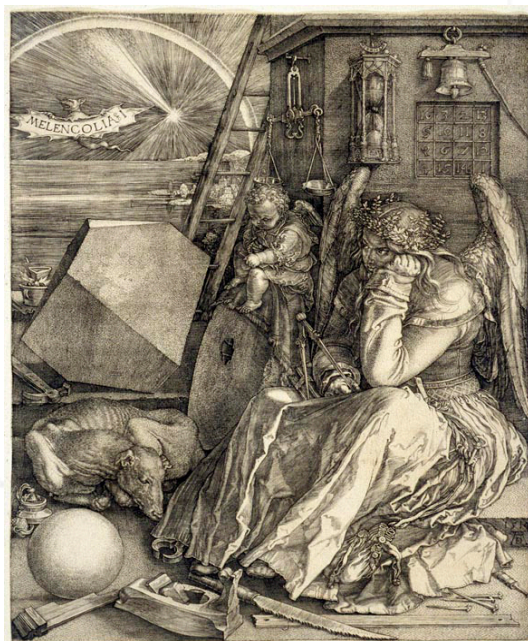
Albrecht Dürer, Melencolia I (1514) Grabado, 24 x 18,8 cm

Una proporción considerable de los retratos de los melancólicos [...] tienen otro motivo en común con Melencolía de Durero; [...] el propio dibujo preliminar de Durero para el grabado, que difiere precisamente en este detalle, demuestra que no debe simplemente su origen a la observación de la actitud del melancólico, sino que nace de una tradición pictórica, en este caso milenaria. Nos referimos al motivo de la mejilla apoyada en la mano. La significación primaria de este gesto antiquísimo, que aparecía incluso en los personajes de duelo de los relieves de sarcófagos egipcios, es el dolor, pero también puede significar fatiga o pensamiento creador. (Klibansky, Panofsky y Saxl, 1991: 281)