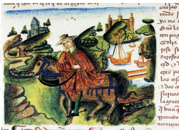
Libro del caballero Zifar, códice P

Son variados los personajes de los libros de caballería, tan caros a don Quijote, en actitud melancólica, con la mano en la mejilla, tanto es así que podríamos afirmar que se trata de un estereotipo literario bien establecido. Lo encontramos en El libro del famoso y muy esforçado caballero Palmerín de Olívia (1511) en un episodio extraordinario que remite a una iconografía codificada: la figura de Demócrito, filósofo hipocondríaco de Abdera, sentado bajo un árbol 3 . Palmerín de Olívia, que se ha dejado guiar por el instinto de su caballo, está en mitad de un bosque y allí ve un enano