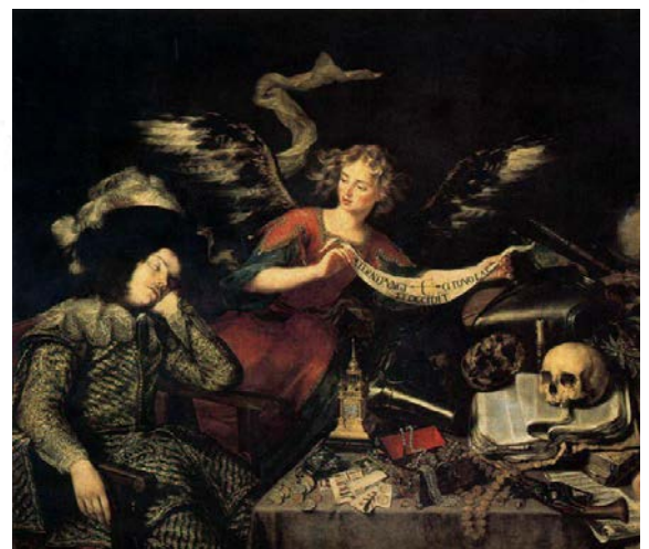
Antonio de Pereda, El sueño del caballero , 1650, 152 x 217 cm, Academia de S. Fernando

En efecto, junto a la afortunada circulación de Melancolía I de Durero recordemos otra xilografía suya que abre la serie de la Passio Christi (1511), con la imagen de Cristo con la mano en la mejilla, y la figura con la mano en la mejilla identificada con Eráclito-Miguel Ángel mientras escribe uno de sus sonetos, pintada por Rafael entre