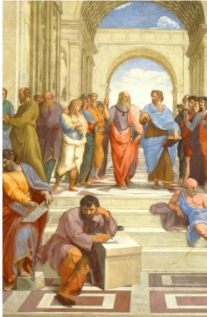
Rafael Sanzio, La escuela de Atenas (detalle) fresco, 500 x 700 cm, Museos Vaticanos

No solo vertebra la literatura, sino también la pintura de aquellos siglos. En realidad, el motivo tiene profundas raíces, se remonta al mundo clásico, que ya representaba a Áyax, héroe melancólico, en esculturas y ánforas. Pero es que ahora,