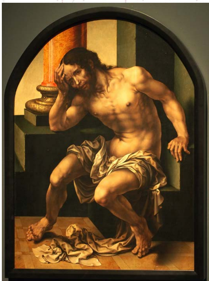
Fig. 3. Jan Gossaert 'Mabuse', Cristo, varón de dolores , 1530, Museo del Patriarca, Valencia, óleo sobre tabla, 112 x 84 cm