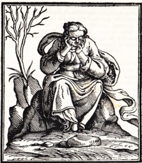
Cesare Ripa, Iconologia

se subió en una costezuela que junto al aldea estaba, y allí, sentándose al pie de un antiguo fresno, puesta la mano en la mejilla y la caperuza encajada hasta los ojos, que en el suelo tenía clavados, comenzó a imaginar el desdichado punto en que se hallaba y cuán sin poderlo estorbar, ante sus ojos, había de ver coger el fruto de sus deseos. (Cervantes, 2014: III, 163)