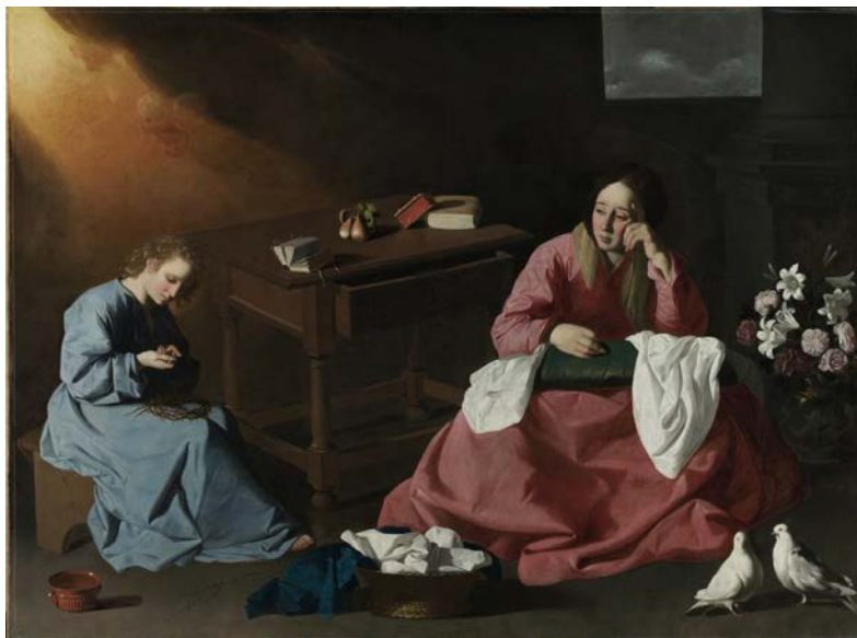
Fig. 1. Francisco de Zurbarán, La casa de Nazaret , 1630 (óleo, 165 x 230 cm, The Cleveland Museum of Art, dominio público; https://commons.wikimedia.org/w/index.php?curid=46835632 )