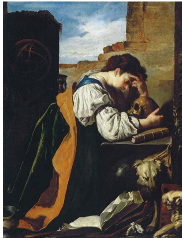
Fig. 8, Domenico Fetti, La melancolía (Maria Maddalea in meditacione) , ca. 1616-1623) 168 x 128 cm, Museo del Louvre,