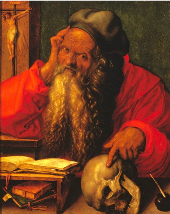
Fig. 5, Albrecht Dürer, San Jerónimo en su estudio (1521) Museo Nacional de Arte Antiga, Lisboa, óleo sobre lienzo, 60 x 48 cm https://commons.wikimedia.org/w/index.php?curid=5498495