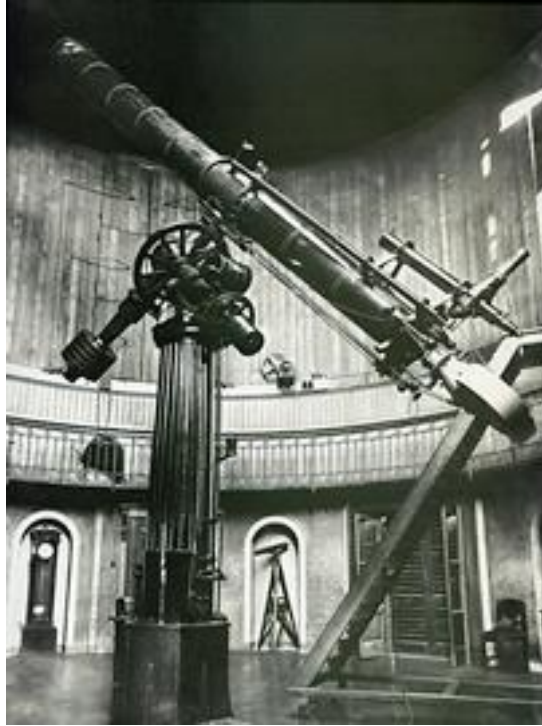
Fig. 3 Telescopio rifrattore Merz-Repsold – Osservatorio di Brera Milano