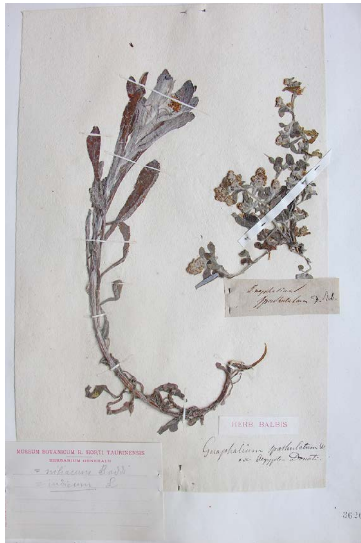
Fig. 3 Campione di Gnaphalium "ex Aegypto Donati" nell'Erbario Balbis, Università di Torino. Riproduzione autorizzata.

Fra gli esemplari di Donati 'ex Aegypto' ritrovati, tutti in ottime condizioni, si possono citare Acacia Lebbec , Cineraria bicolor , Sennebiera nilotica , Medicago gerardi , Dolichos parviflora , Hagea villosa , Erodium malopoides , Gnaphalium spathulatum .