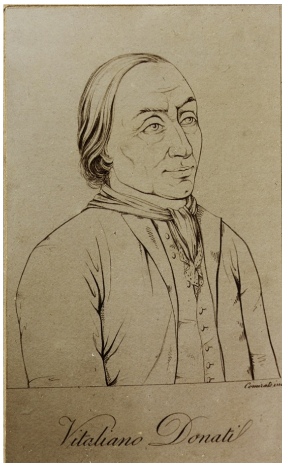
Fig. 1 Ritratto di Vitaliano Donati. Biblioteca dell'Orto Botanico di Padova. Riproduzione autorizzata.

Ci è parso perciò doveroso, nel terzo centenario dalla nascita, ricostruire l' iter culturale e umano di Donati, riunendo quanto su di lui è già stato scritto, rivisto alla luce di alcune nuove notizie emerse dagli studi di altri personaggi della sua epoca, e indicare alcune ricerche in fase di realizzazione, che potranno valorizzare la sua figura e la sua opera, sia nell'ambito dell'Università di Torino, sia nelle altre sedi in cui sono conservati i materiali salvati dal naufragio.