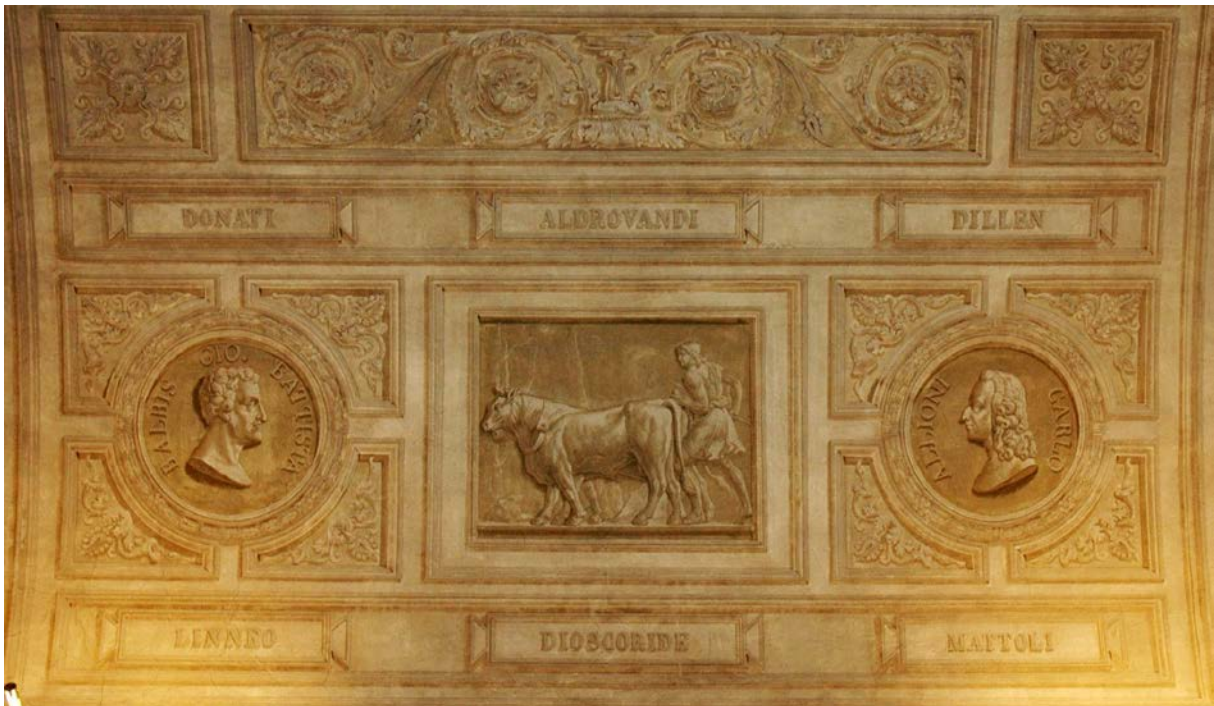
Fig. 5 Particolare dell'affresco monocromo della volta della Sala di Lettura di BRT, opera di Angelo Moja e Marco Antonio Trefoli su progetto di Pelagio Palagi 1841, dove compaiono affiancati i nomi di Carlo Linneo e di Vitaliano Donati. Riproduzione autorizzata.

Donati fu certamente una mente aperta a tutti i campi delle scienze, ebbe grande capacità e versatilità nel costruire gli strumenti che gli servivano per le sue misurazioni e dimostrò sempre disponibilità e coraggio nell'affrontare viaggi per terra e per mare, anche quando si trovò da solo ad affrontare pericoli e fatiche. Queste caratteristiche lo resero forse troppo diverso dal carattere più conservatore del mondo accademico torinese dell'epoca, impedendogli di costruire saldi rapporti con i più stretti collaboratori, così che, dopo la prematura scomparsa e il sostanziale fallimento di una missione che aveva richiesto ingenti spese e da cui si attendevano risultati economicamente concreti, la sua figura non trovò chi ne valorizzasse i meriti. L'analisi che si vuole realizzare su quanto conservato in altre sedi universitarie e non, sino ad oggi incompleta, potrà certamente far emergere materiali importanti per valorizzare l'impegno che Donati profuse in vari ambiti scientifici, fra cui quello botanico, nella sua sfortunata ultima missione (Fig. 5).