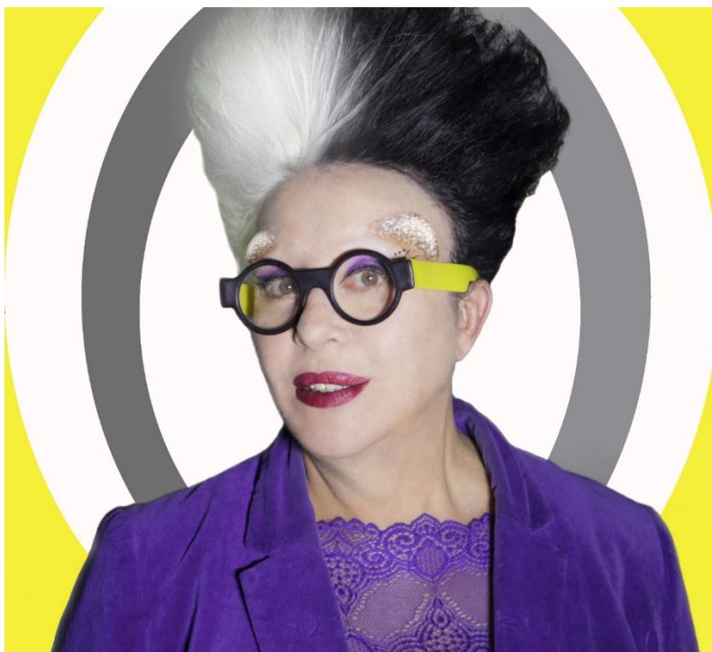
Orlan © Epicure 2020

[il] est un travail d'autoportrait au sens classique, mais avec des moyens technologiques qui sont ceux de son temps. Il oscille entre défiguration et ré-figuration. Il s'inscrit dans la chair parce que notre époque commence à en donner la possibilité. Le corps devient un "ready-made modifié" car il n'est plus ce ready-made idéal qu'il suffit de signer. (49)