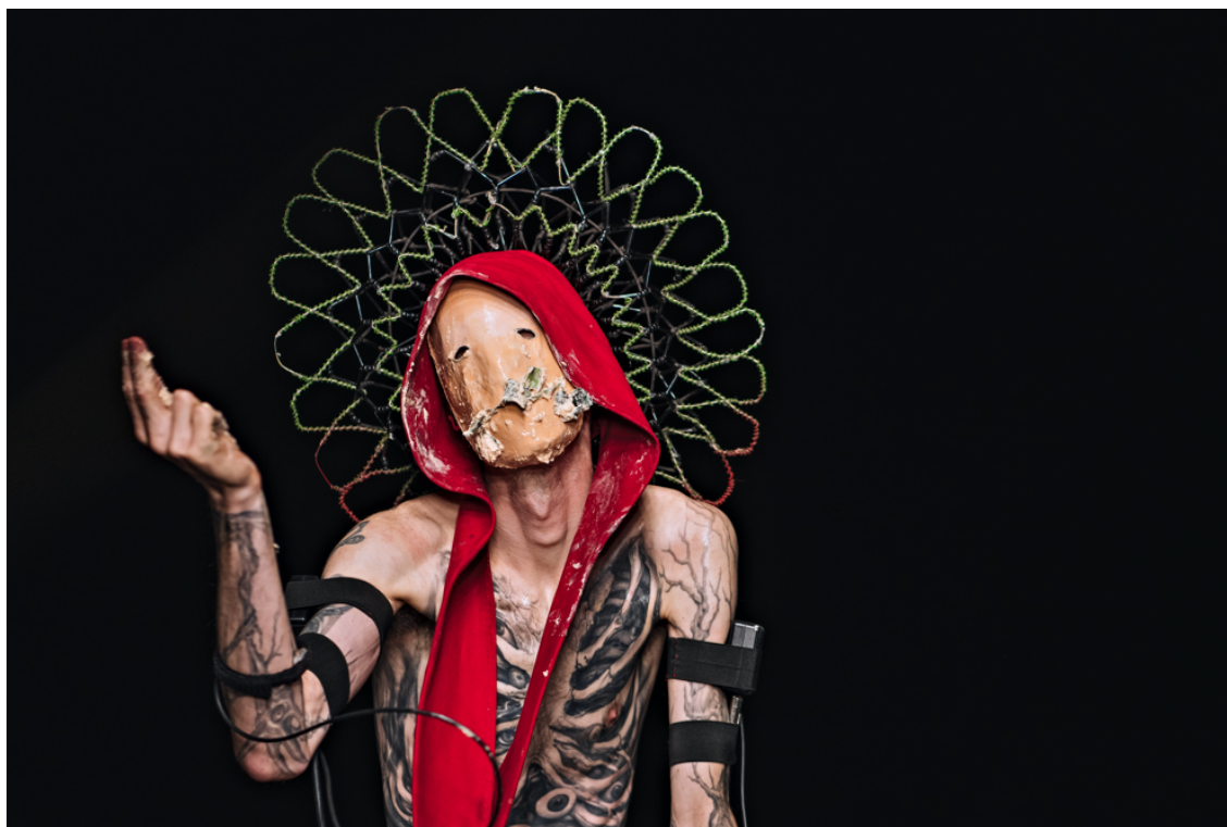
© Marco Donnarumma performing Humane Methods [UR] by Fronte Vacuo. Photo by Damir Zizic.

“mettono in discussione non solo l'etica degli algoritmi, ma anche quella degli individui umani”. 20