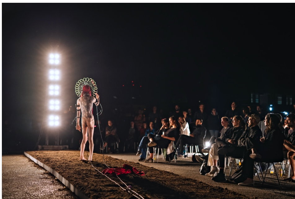
©Marco Donnarumma performing Humane Methods [ŪR] by Fronte Vacuo. Photo by Damir Zizic

percorso rituale che l'uomo e la macchina compiono assieme. Non sappiamo se si tratti di una lotta per la prevaricazione o l'annientamento dell'uno o dell'altro (l'IA aumenta l'intensità della luce impedendo a sé stessa di vedere, di interagire e quindi di "esistere", sottraendo al contempo il corpo alla vista del pubblico) o un tentativo di reciproco avvicinamento e di reciproca comprensione (l'artista "indirizza" i suoi movimenti alla macchina che li integra e li restituisce sotto forma di luce). Si tratta, forse, di un rituale sacrificale. 23 Ma se così fosse, a quale sacrificio stiamo assistendo? A quello dell'uomo, del suo corpo, o della sua identità?