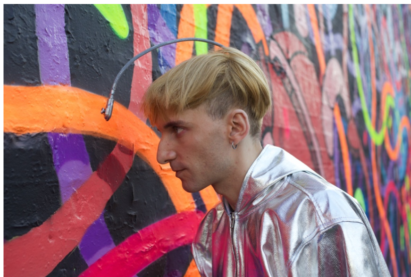
Neil Harbisson © Lars Norgaard

Google, e il cui obiettivo è resuscitare il proprio padre partorendolo) 10 , è pur vero che in ORLAN questo atto di auto-creazione e auto-ricreazione, incarna la lotta, profondamente transumanista, contro l'ineluttabile e l'inesorabile, ovvero la malattia e la morte. Esso è un atto demiurgico che l'artista compie su sé stessa, al contempo creatrice e creazione. Se ORLAN contribuisce all'arte del futuro, plasmando il proprio corpo attraverso la chirurgia plastica e creando cyborg futuristi e femministi a sua immagine e somiglianza 11 , Neil Harbisson è un vero e proprio artista-cyborg 12 .