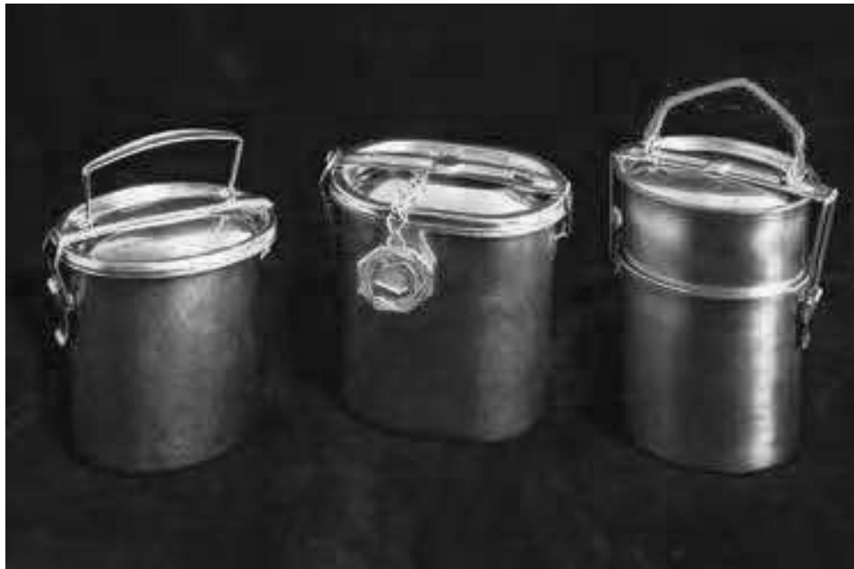
Figura 1. Barachin a due scomparti in acciaio. Il recipiente più piccolo, posto nella parte superiore del barachin , di solito conteneva la seconda portata. La parte più capiente del barachin , di norma immersa nell'acqua degli scaldavivande, era destinata a custodire il primo piatto: la minestra o la pastasciutta.