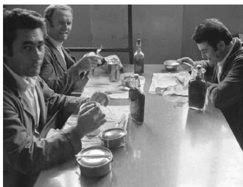
Figura 4. Barachin e vino sul tavolo operaio, 1973.