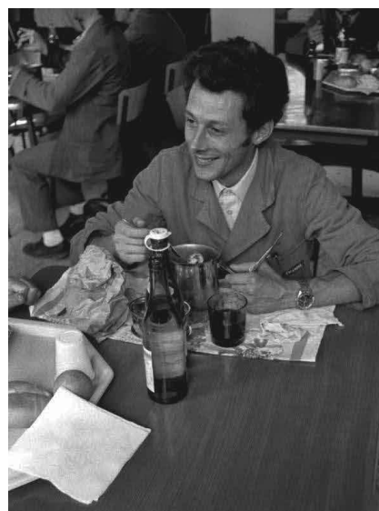
Figura 5. Operaio della Emanuel in mensa, 1973, foto Mauro Raffini.